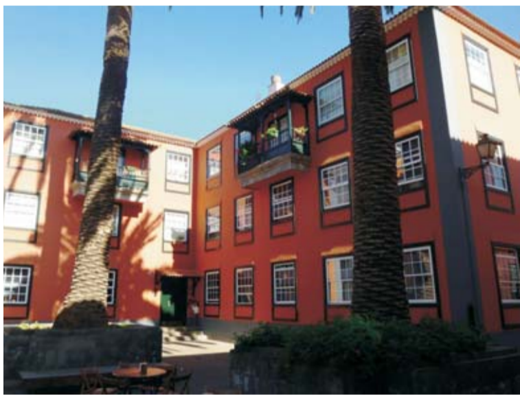
Gestión pública. Vivienda de estilo canario con balcones (calle Viana).

Como revelan las fotos a continuación, uno de los daños irreversibles causados por la gestión privada del centro histórico afecta a la construcción de nuevos edificios que no respetan ni el estilo ni la tipología de la casa lagunera, a diferencia de los edificios nuevos construidos con una gestión pública del centro.