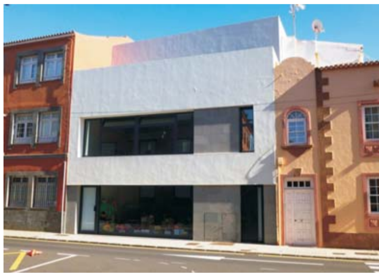
Gestión privada. Destrucción de una casa terrera para construir un edificio sin estilo definido (calle del Agua).