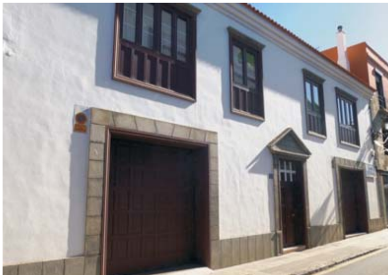
Gestión pública. Vivienda en estilo canario con huecos simétricos y un tímpano sobre la puerta principal (calle Tabares de Cala).