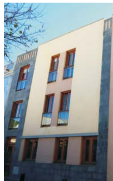
Gestión privada. Vivienda de estilo no canario que reemplazó a un edificio tradicional de dos plantas (plaza del Cristo).