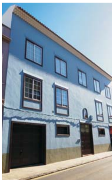
Gestión pública. Vivienda en estilo canario con el detalle de la hornacina de un santo sobre la puerta de entrada (calle Tabares de Cala).