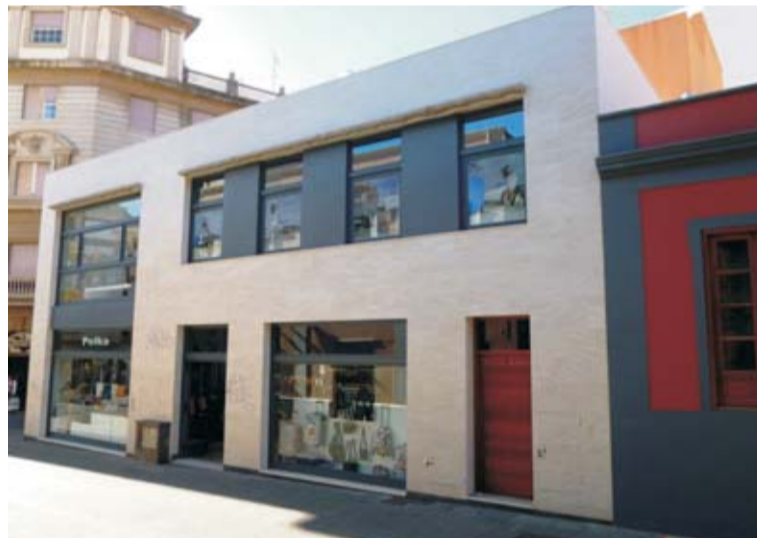
Gestión privada. Destrucción de tres casas terreras para construir un edificio de dos plantas sin estilo definido (calle Viana).