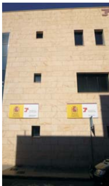
Gestión privada. Edificio institucional de estilo no tradicional (calle Santiago Cuadrado).