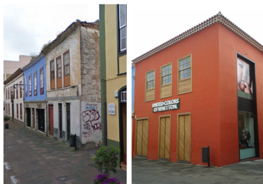
Foto 1. Antes: Casa escalonada en la esquina de Herradores y Maquila antes de su demolición. Después: Franquicia de Benetton tras la demolición del interior y derribo del muro.