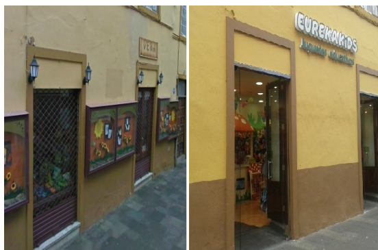
Foto 2. Antes: Imprenta y papelería Vera, fundada en 1910 y cerrada en 2012. Después: Eureka Kids, franquicia representada por el Grupo Número 1.