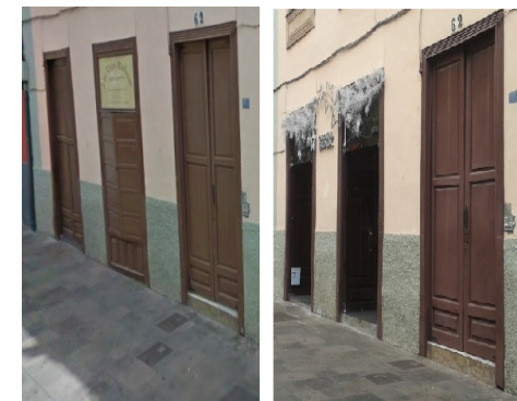
Foto 3. Antes: Las Tres Madejas, desaparecida tienda local de ropa, confección y textiles. Después: Carolina Boix, franquicia multinacional de calzado y complementos.