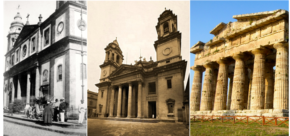
Catedral. Escalinata neoclásica. 1838

Fachada neoclásica de la Catedral de La Laguna, la Catedral de Pamplona (modelo de la lagunera) y templo griego clásico